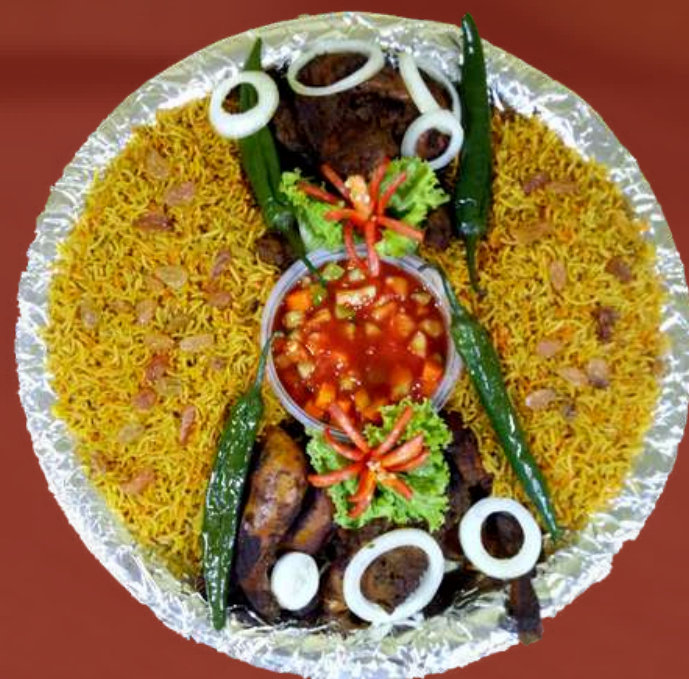
Nasi Kebuli / Mandhi